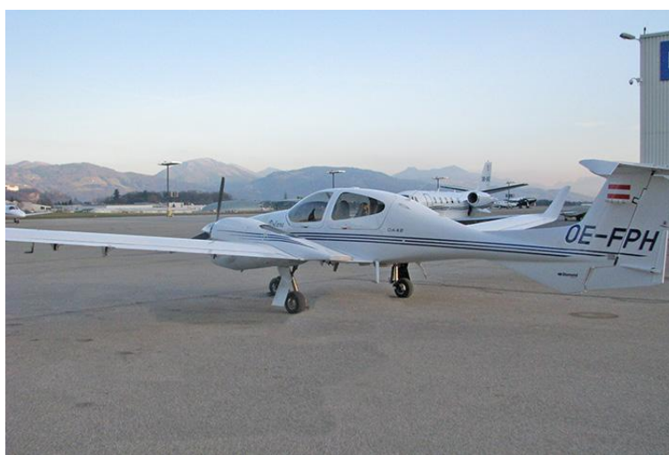
DA 42 NG

Kontakte der Mitgliedsvereine siehe Information I 01 "Unsere Flugschule".